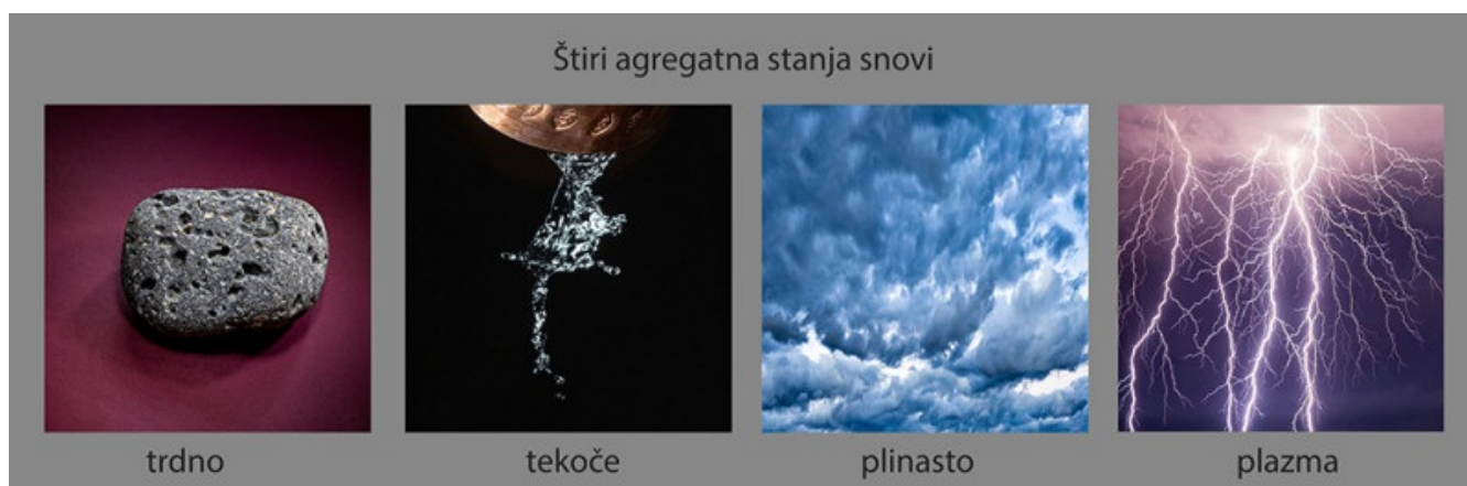
Slika 2: Štiri agregatna stanja v naravi

Plazma je stanje snovi, ki se razlikuje od trdnih snovi, tekočin in plinov. Včasih jo imenujemo četrto agregatno stanje (Slika 2), saj ima edinstvene lastnosti, zaradi katerih je uporabna na številnih področjih.