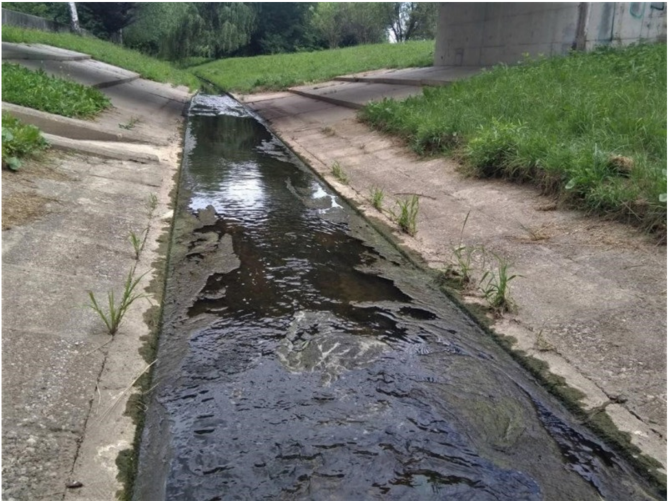
Veliko rek in potokov je spremenjenih v kanale; struga je izravnana, bregovi pa so utrjeni z betonom. Na fotografiji je primer potoka Glinščica v Ljubljani.

Poleg reguliranja rečnih strug izsušujemo mokrišča za potrebe kmetijstva, drugod pa odvezujemo vodo za namakanje polj. Vsakodnevno uporabljamo pesticide, zdravila in druge snovi, ki končajo v vodi, se kopičijo v vodnih organizmih ter po prehranjevalni verigi vstopajo nazaj v naša telesa. Načrtno ali nenačrtno vnašamo tujerodne organizme, ki z domorodnimi vrstami tekmujejo za hrano in prostor, jih plenijo ali prenašajo zajedavce in bolezni. V vode se stekajo velike količine hranil, predvsem dušika in fosforja, kar lahko predvsem v stoječih in počasi tekočih vodah vodi do eutrofikacije (presežka hranil). To spodbuja čezmerno razrast alg in cianobakterij, ki s tvorbo gošč na površini omejujejo prehajanje svetlobe in kisika v globlje plasti. Ob bakterijski razgradnji tako velike biomase se porablja velika količina kisika, kar lahko vodi v množične pogine rib in drugih vodnih organizmov. Če gošče tvorijo cianobakterije ( https://doi.org/10.3986/alternator.2022.38 ), se lahko v okolje sproščajo tudi cianotoksini – strupene snovi, ki škodijo zdravju ljudi in živali.