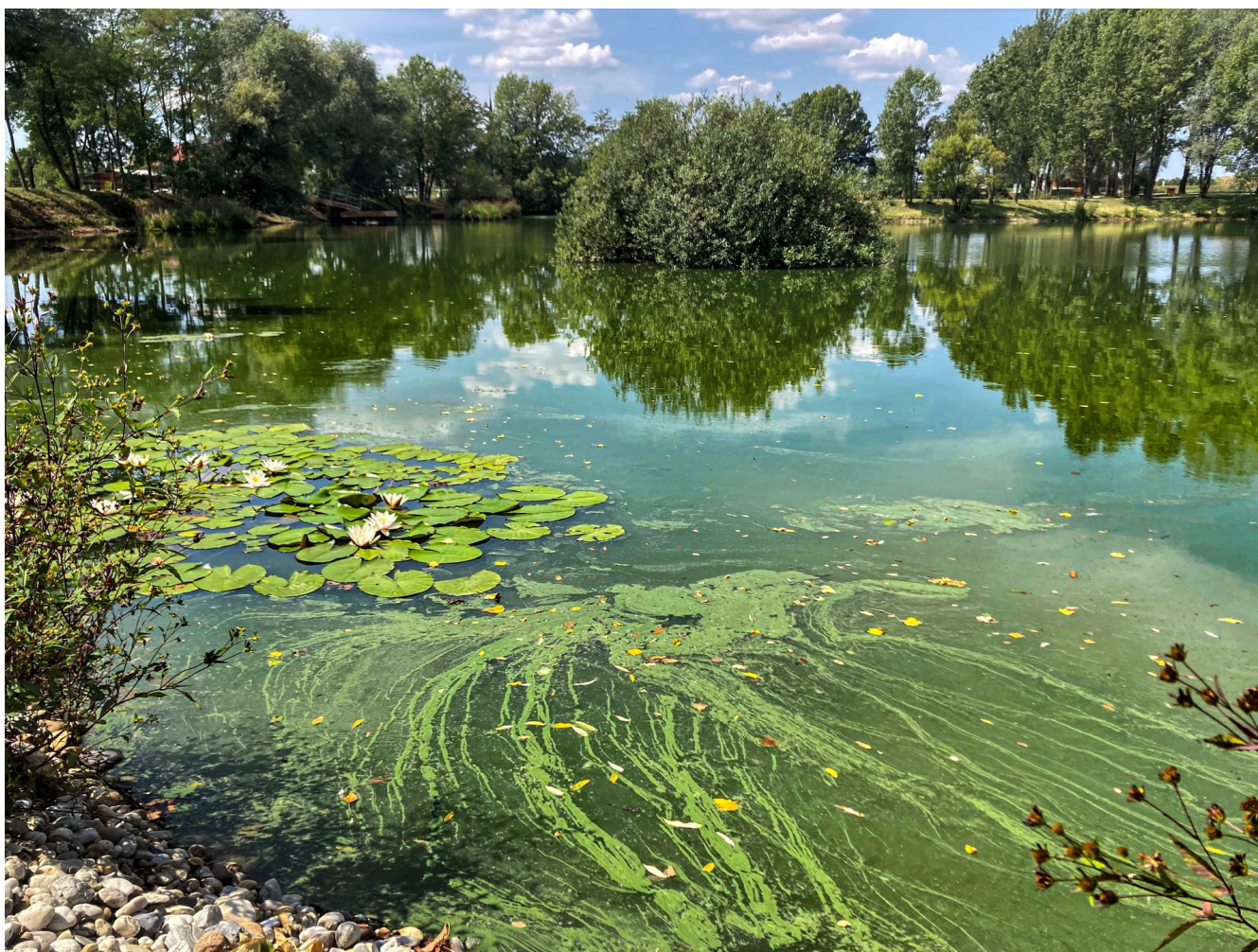
Cianobakterijska gošča na površini gramoznice Boreci v bližini Ljutomera.

Medtem ko so vse oči uprte v podnebno krizo, se za našimi hrbti odvija druga – biodiverzitetna kriza. Priče smo pravi ruski ruleti degradacije okolja in izgube habitatov in zdi se, da so v njej prav celinske vode potegnile najkrajšo. Mokrišča izginjajo trikrat hitreje kot gozdovi ( https://doi.org/10.1093/biosci/biaa002 ), populacije vodnih vretenčarjev pa upadajo dvakrat hitreje kot na kopnem in v morju. Od leta 1970 so se njihove populacije zmanjšale za 83 % ( https://wwflpr.awsassets.panda.org/downloads/living_planet_report_2022.pdf ), izgubili pa smo 30 % površinskih vodnih ekosistemov ( https://doi.org/10.1016/j.biocon.2015.10.023 ). Je že vse izgubljeno? Oglejmo si razsežnost človeškega vpliva, trenutno stanje in nekaj potencialnih rešitev.