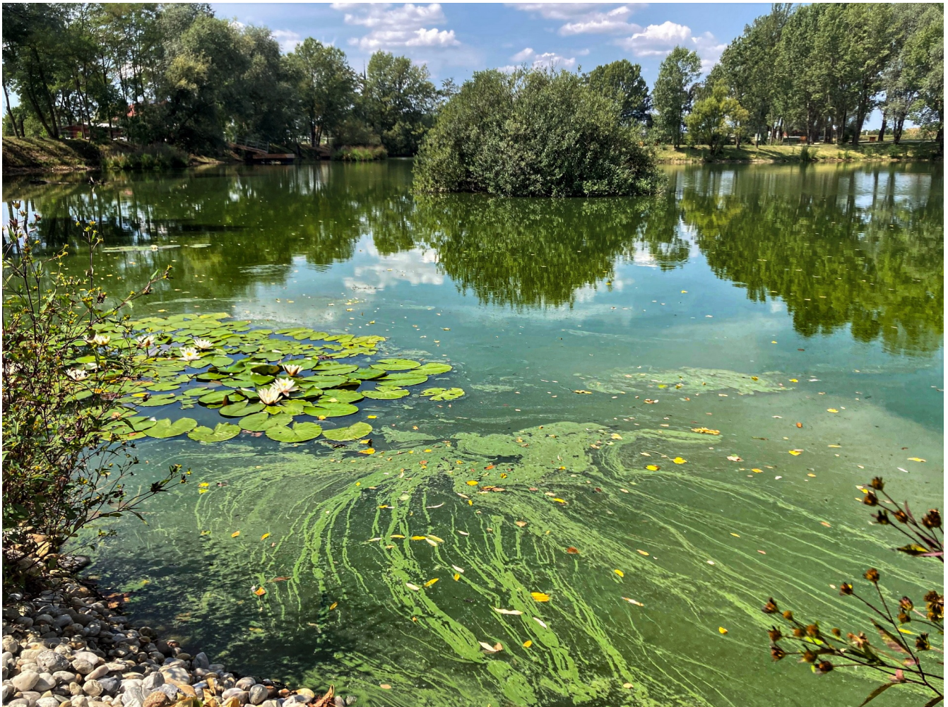
Cianobakterijska gošča na površini gramoznice Boreci v bližini Ljutomera.

Medtem ko so vse oči uprte v podnebno krizo, se za našimi hrbti odvija druga – biodiverzitetna kriza. Priče smo pravi ruski ruleti degradacije okolja in izgube habitatov in zdi se, da so v njej prav celinske vode potegnile najkrajšo. Mokrišča izginjajo trikrat hitreje kot gozdovi ( https://doi.org/10.1093/biosci/biaa002 ), populacije vodnih vretenčarjev pa upadajo dvakrat hitreje kot na kopnem in v morju. Od leta 1970 so se njihove populacije zmanjšale za 83 % ( https://wwflpr.awsassets.panda.org/downloads/living_planet_report_2022.pdf ), izgubili pa smo 30 % površinskih vodnih ekosistemov ( https://doi.org/10.1016/j.biocon.2015.10.023 ). Je že vse izgubljeno? Oglejmo si razsežnost človeškega vpliva, trenutno stanje in nekaj potencialnih rešitev.