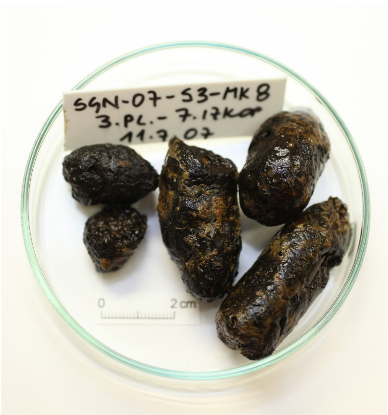
Slika 4: Pasji iztrebki iz koliščarskih plasti na Ljubljanskem barju

krapovci, ostriž, rdečeoka, ščuka. Ker gre v kulturni plasti navadno za iste vrste rib, a večjih dimenzij, gre zaključiti, da se je koliščarski pes tudi na Starih gmajnah moral zadovoljiti s tistim, kar je človek zavrzel. Da so iztrebki dejansko pasji in ne denimo človeški, nam je potrdila tudi paleoparazitološka analiza. V vseh treh analiziranih iztrebkih smo odkrili jajčeca glist in trakulj, značilna za pasjega gostitelja.