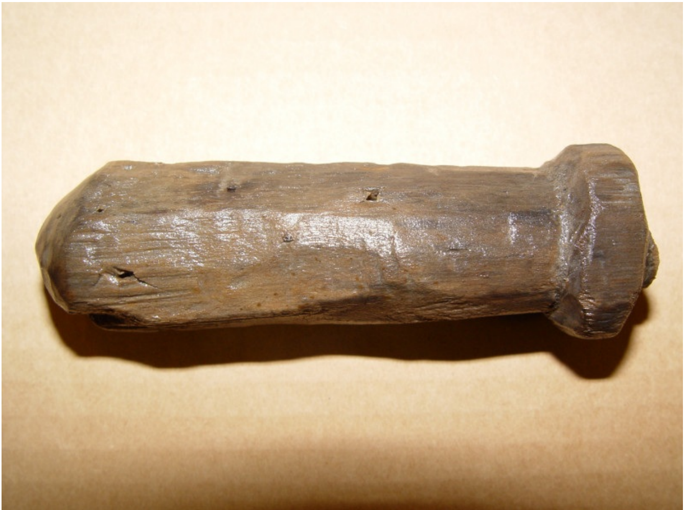
Slika 1: Drenov ročaj neznanega lesenega orodja, star več kot 5000 let

Koliščarji se niso oblačili le v kožuhovino, kot je večkrat predstavljeno na njihovih upodobitvah. Znali so tudi presti in tkati iz vlaken najrazličnejših rastlin, sprva divjih, kasneje tudi gojenih (npr. lan). Medtem ko iz tujine večkrat poročajo o koprivnih vlaknih in vlaknih iz lipovega lubja oziroma ličja, smo na Slovenskem doslej analizirali le eno izredno lepo spredeno koliščarsko prejo (slika 2), katere mikroskopska analiza je pokazala, da je bila narejena iz semenskih in stebelnih vlaken rastline iz družine trav, ki nam je vrstno še ni uspelo identificirati.