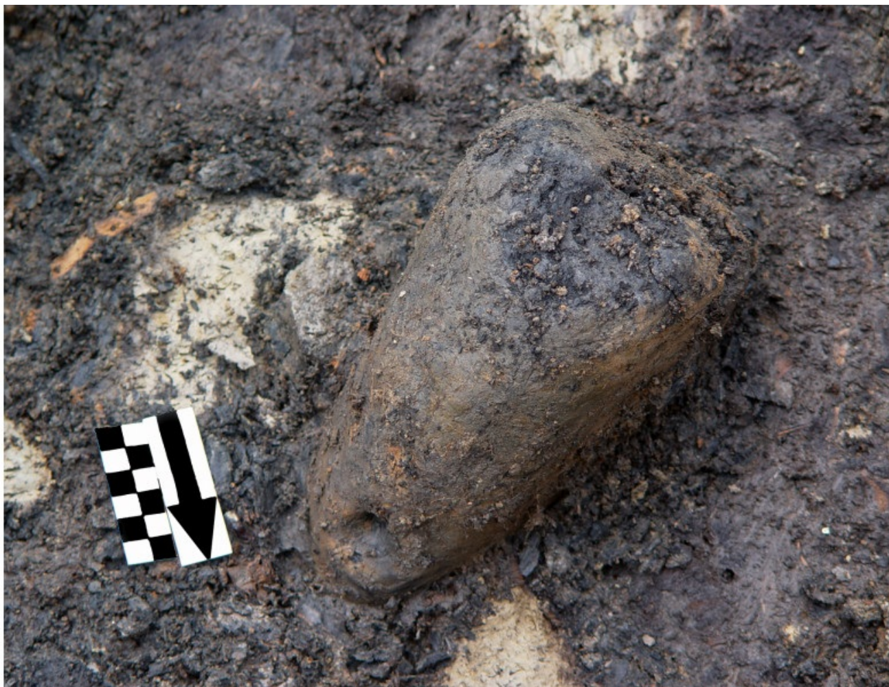
1 / 3 Slika 6a: Velika glinena utež ob odkritju