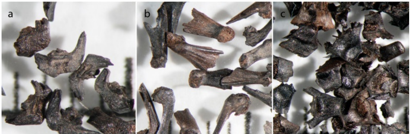
3 / 3 Slika 6b: »Zakladnica« žitnih plev v glineni uteži