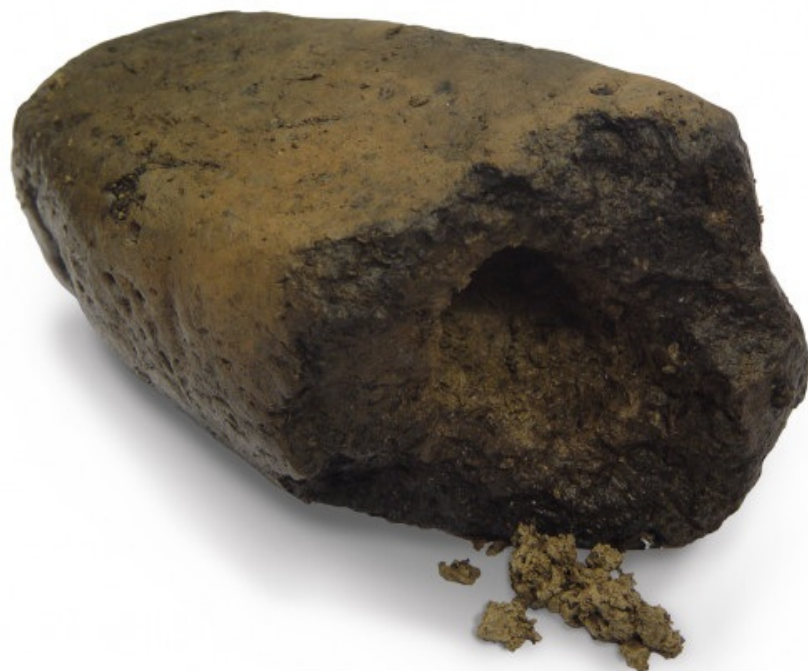
2 / 3 Slika 6a: Velika glinena utež po čiščenju