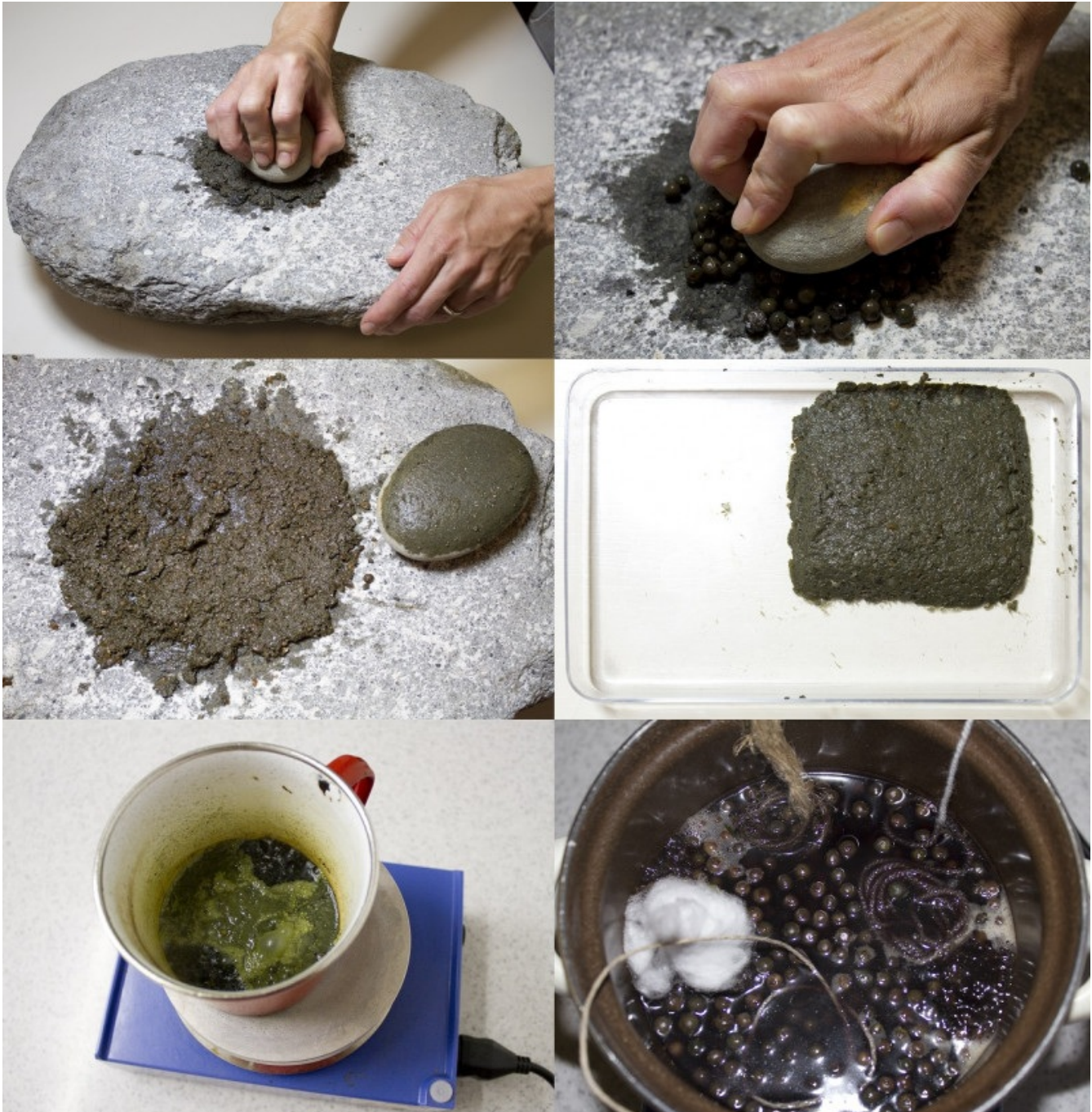
Slika 3: Eksperimentalno delo s svežimi plodovi rdečega dreva

Pes velja za najstarejšo udomačeno žival; človeka je branil pred divjimi zvermi, mu pomagal pri lovu in mu zvesto sledil. Človek mu je v zameno dajal hrano in tako se je med njim spletlo zavezništvo, ki traja vse do danes. Kaj točno mu je človek ponujal oziroma kakšen status je imel pes pri človeku pred dobrimi 5000 leti, je delno pokazala tudi raziskava pasjih iztrebkov, ohranjenih v koliščarskih plasteh (slika 4). Iztrebek iz kolišča Črnelnik je v večini vseboval ploščate kosti ribjih glav, luske in zobe rib iz družine krapovcev ( Cyprinidae ), v manjšem deležu pa tudi nekaj rastlinskih ostankov: posamična semena lanu, robide, ogrščice, breze, bele metlike in del plodu vodnega oreška. Analiza je pokazala, da so psa hranili z ostanki, tj. ribjimi glavami, nekaj rastlinskih ostankov pa je najverjetneje zaužil mimogrede, npr. med pitjem vode iz jezera. Semena in plodovi kažejo na okolje, v katerem je živel, in na jesenski letni čas. Velikost (predvsem širina) dobro ohranjenega iztrebka poda tudi informacijo o velikosti psa – šlo je za psa, manjšega od volka, katerega iztrebki so od 1 do 2 cm širši. Hranjenje z ribjimi glavami, ne pa tudi z ostalimi deli ribjega telesa, priča o navadah hranjenja psov, lahko bi rekli tudi o oskrbi psa, saj same ribje kosti niso hranljive (poleg tega so tudi nevarne), medtem ko pri glavah vsaj nekaj hranljivega ostane tudi za psa.