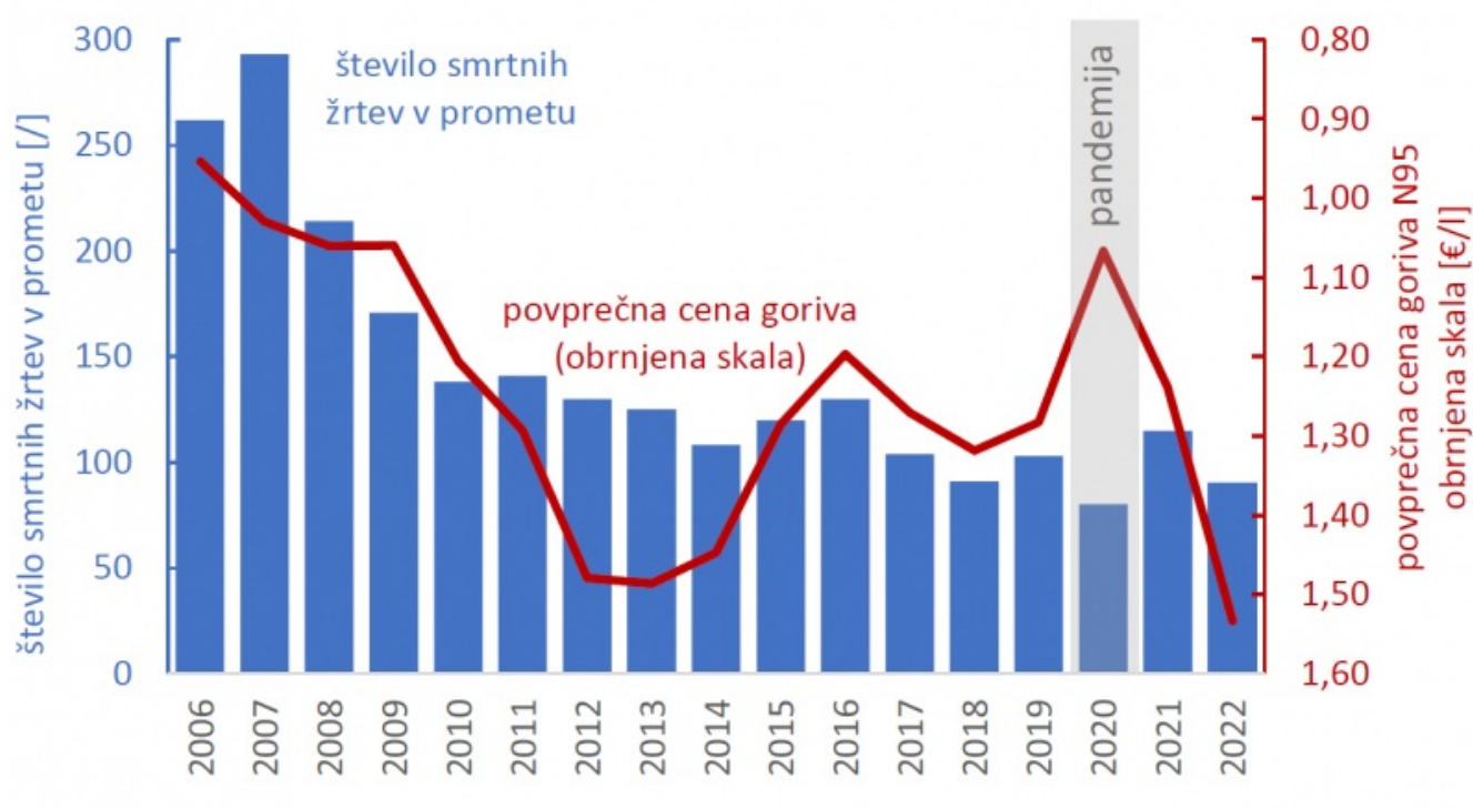
Slika 3: Število smrtnih žrtev v prometu in povprečna cena neosvinčenega 95-oktanskega goriva v letih 2006–2022

Na količino prometa vplivajo tudi cene energentov oziroma avtomobilskega goriva. Nekatere študije ( https://www.econstor.eu/bitstream/10419/231318/1/1749270188.pdf ) kažejo, da se pri povečanju cene goriva za 10 % povprečna prevožena razdalja zmanjša za 1,4–4 %. Spet druge študije ( https://www.econstor.eu/bitstream/10419/62394/1/722418833.pdf ) dokazujejo, da visoke cene goriva vplivajo tudi na počasnejšo in s tem varčnejšo vožnjo (čeprav je ugotovljen vpliv povišanja cene res majhen). Toda počasnejša (in previdnejša) vožnja skupaj z manjšim obsegom prometa lahko prispeva tudi k večji prometni varnosti. Slika 3 prikazuje število smrtnih žrtev v prometu in povprečno ceno neosvinčenega 95-oktanskega goriva v letih 2006–2022. Cena goriva je prikazana z obrnjeno skalo z namenom lepšega prikaza ujemanja med obema podatkom.