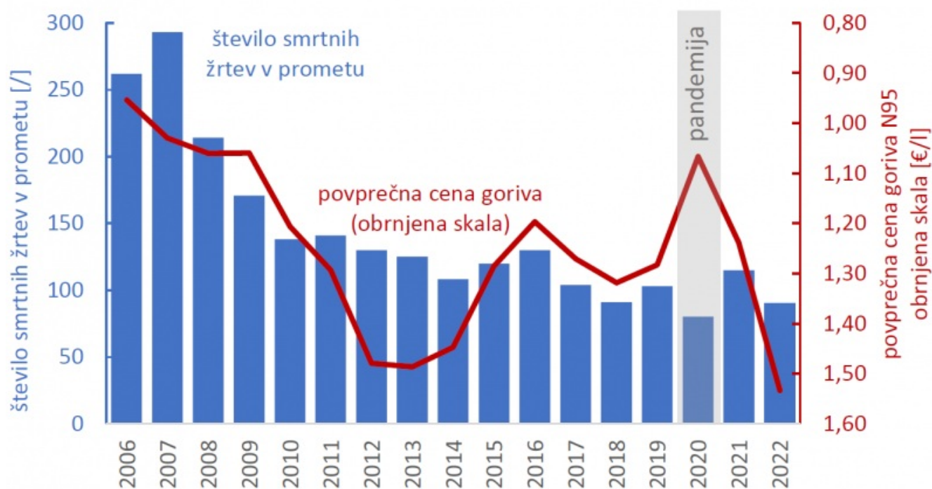
Slika 3: Število smrtnih žrtev v prometu in povprečna cena neosvinčenega 95-oktanskega goriva v letih 2006–2022

Na količino prometa vplivajo tudi cene energentov oziroma avtomobilskega goriva. Nekatere študije ( https://www.econstor.eu/bitstream/10419/231318/1/1749270188.pdf ) kažejo, da se pri povečanju cene goriva za 10 % povprečna prevožena razdalja zmanjša za 1,4–4 %. Spet druge študije ( https://www.econstor.eu/bitstream/10419/62394/1/722418833.pdf ) dokazujejo, da visoke cene goriva vplivajo tudi na počasnejšo in s tem varčnejšo vožnjo (čeprav je ugotovljen vpliv povišanja cene res majhen). Toda počasnejša (in previdnejša) vožnja skupaj z manjšim obsegom prometa lahko prispeva tudi k večji prometni varnosti. Slika 3 prikazuje število smrtnih žrtev v prometu in povprečno ceno neosvinčenega 95-oktanskega goriva v letih 2006–2022. Cena goriva je prikazana z obrnjeno skalo z namenom lepšega prikaza ujemanja med obema podatkom.