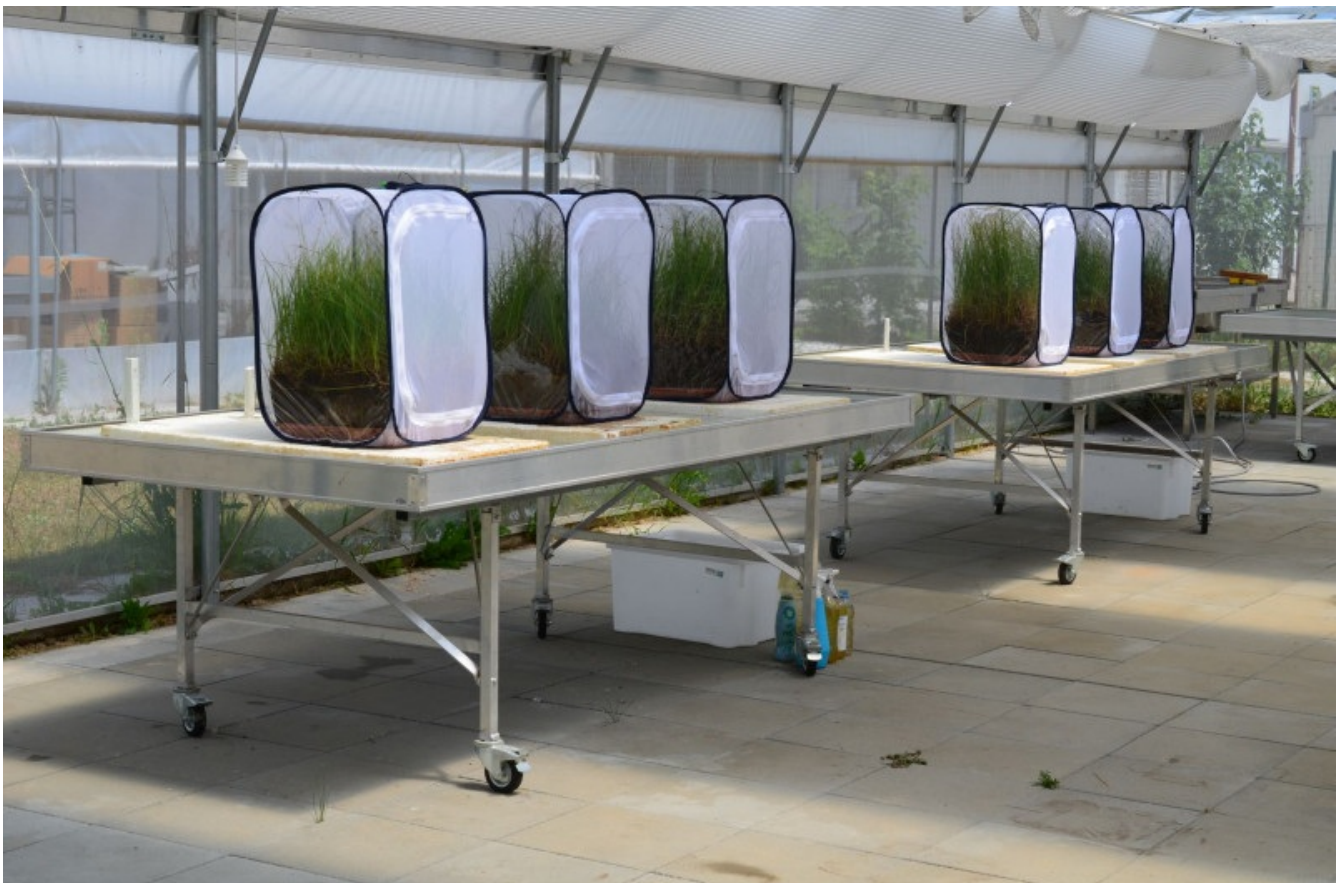
Gojilnica z insektariji na Raziskovalni postaji Barje ZRC SAZU. V vsakem insektariju smo med odlaganjem jajčec zadrževali le eno oplojeno samico in jo po 3–4 dneh vrnili v izvorno populacijo.

Pot, ki smo jo prehodili do prvega uspeha, se je pričela s pridobitvijo treh dovoljenj Agencije RS za okolje: za odvzem izvornih osebkov iz narave, za gojenje vrste ex situ ter za vnos gojenih osebkov v območje reintrodukcije in v izvorno populacijo. Že tu smo krepko »oralni ledino«, saj je reintrodukcija barjanskega okarčka prvi poskus ponovne naselitve nevretenčarske vrste v Sloveniji. Po zmagovitem preskoku te dokaj visoke ovire in postavitvi infrastrukture za gojenje vrste ex situ na Raziskovalni postaji Barje ZRC SAZU (kot je prikazano na spodnji sliki) se je pričela implementacija vseh teoretično, a preiščljeno prehojenih 6 korakov iz predstavljenega sheme smernic IUCN.