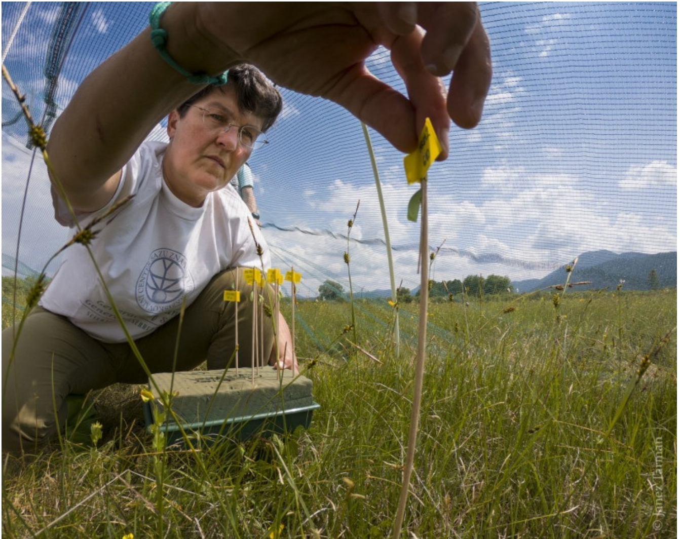
Reintrodukcijski šotor v juniju 2021.

Med dvema gojenji ex situ (2019–2021) smo iz 12 oplojenih samic, odvzetih iz izvorne populacije in vrnjenih vanjo po ovipoziciji, vzgojili 306 bub; 40 smo jih suplementirali v izvorno populacijo, 266 pa vnesli v območje reintrodukcije. Tam smo v obeh letih (2020, 2021) vnosov postavili reintrodukcijski šotor, katerega namen je bil preprečiti disperzijo metuljev izven območja reintrodukcije, kar je v postopku aklimatizacije osebkov na novo okolje najbolj pogost pojav (Berger-Tal idr. 2019 ( https://zslpublications.onlinelibrary.wiley.com/doi/epdf/10.1111/acv.12534 )).