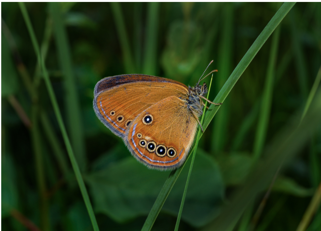
Barjanski okarček (samec), foto: Tatjana Čelik