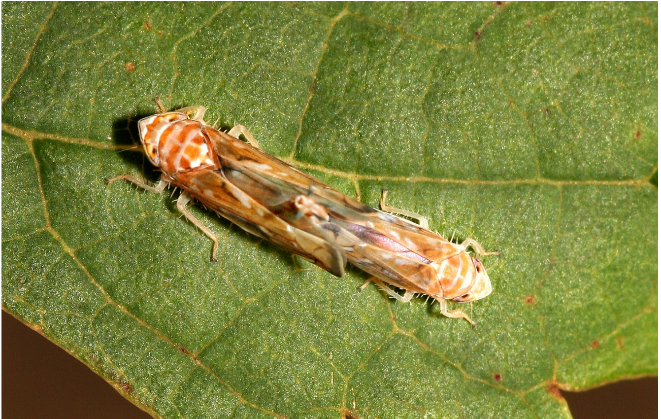
Ameriški škržatek ( Scaphoideus titanus ), parjenje