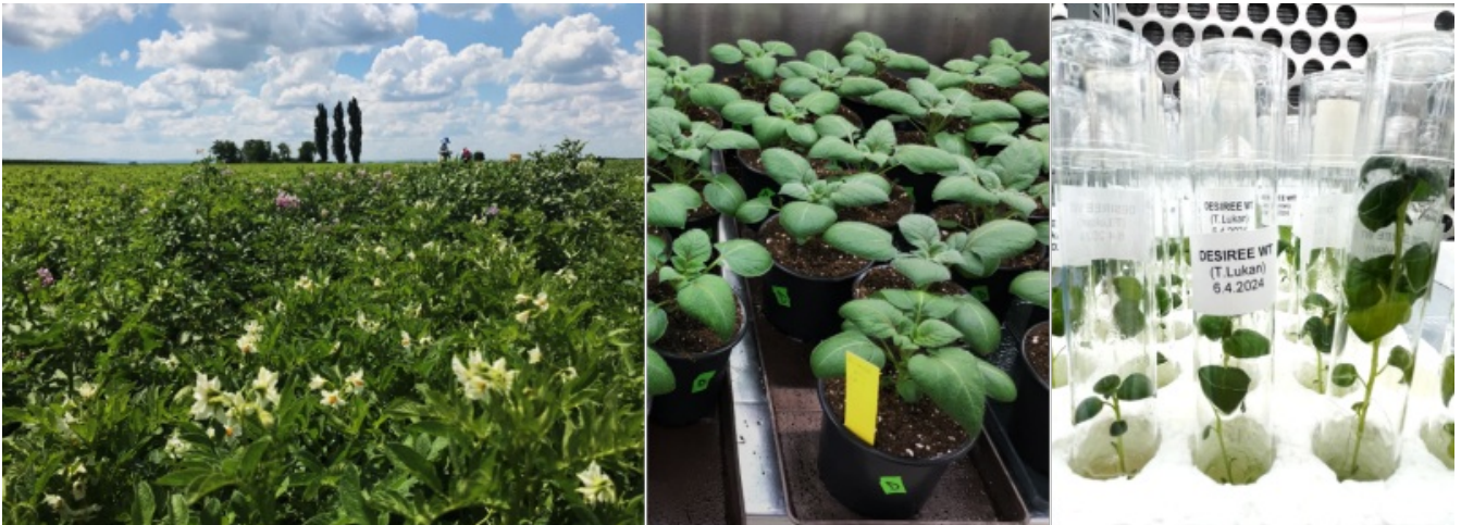
Slika 3: Krompir na polju in v laboratoriju v zemlji ter tkivnih kulturah

Zakaj torej pri nas raziskujemo ravno krompir? Zdaj lahko povzameva, da se v naši skupini pri krompirju srečujejo raziskave temeljne in že bolj aplikativne znanosti. Temeljne raziskave se danes dotikajo predvsem razvoja sistemske biologije ( https://en.wikipedia.org/wiki/Systemic_biology ) pri rastlinah. Pri tem vključujemo omične metode, pri katerih spremljamo npr. ravni izražanja vseh genov proučevanega organizma, in matematično modeliranje odziva celotnega omrežja genov, saj poleg jakosti njihovega izražanja spoznavamo tudi povezave med njimi na različnih ravneh. Tako proučujemo kompleksne lastnosti, v katere je vključeno veliko število genov in pri katerih obravnava posamičnih genov ne razloži dogajanja na ravni celotnega organizma. Med takšne kompleksne lastnosti sodijo že omenjeni odzivi rastlin na škodljivce in neugodne vremenske razmere pa tudi na simbiotske organizme. Uporaba orodij sistemske biologije pri raziskavah na krompirju olajša prenos oziroma aplikacijo tega temeljnega znanja, saj z njimi odkrivamo npr. nove genetske markerje za odpornost krompirja na stresne dejavnike: okužbo s PVY, napad koloradskega hrošča, sušo, vročino in preveliko namočenost tal. Te markerje bodo v prihajajočih letih v programe žlahtnjenja vključevala številna svetovna podjetja, pri nas pa tudi Kmetijski inštitut Slovenije.