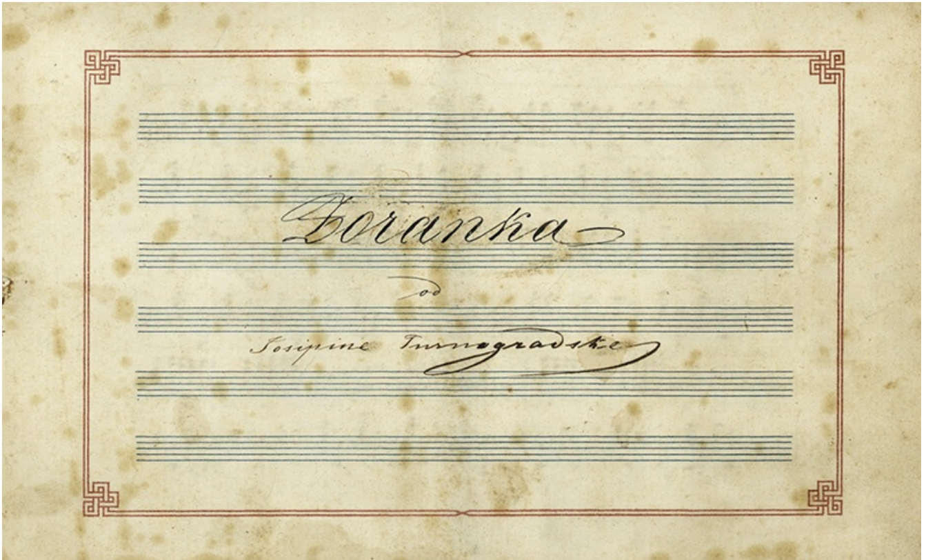
Slika 1: Josipina Turnograjska: Zoranka za klavir, vir: NUK

Ijubiteljskih pianistk in je objavljala klavirske priredbe iz znanih oper, uvertur, baletov in arij, izvedenih v lokalnih in tujih gledališčih, s čimer je obogatila repertoar salonskih nastopov.