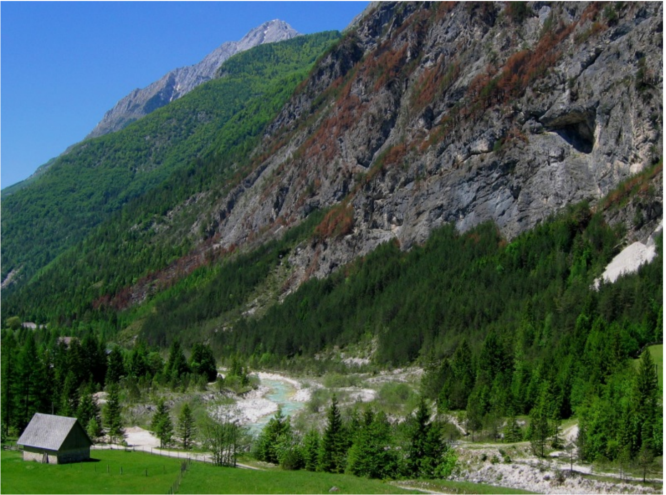
V požaru je pogorel varovalni gozd nad Markovim mostom v Trenti.

Kljub temu, da so požari zaradi bližine gozda naseljem in škode vedno večja grožnja, lahko s sodobnim satelitskim ali daljinskim opazovanjem, monitoringom vremena in sušnosti, prilagajanjem kritične infrastrukture, upravljanjem rabe zemljišč ter ozaveščanjem omilimo našo ranljivost in s tem zmanjšamo prihodnjo ogroženost zaradi požarov.