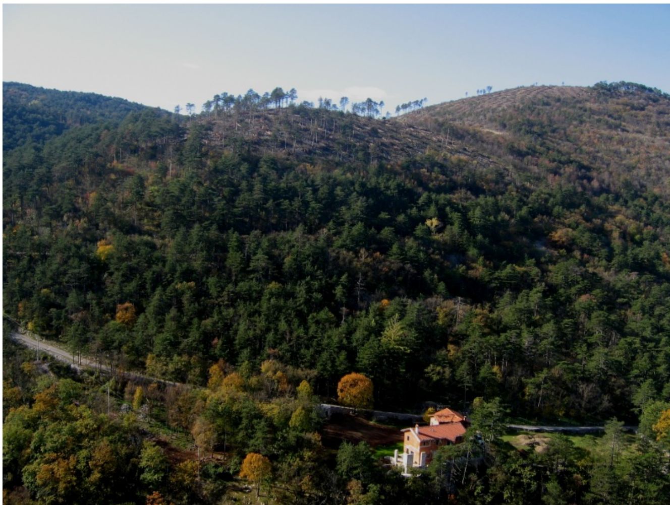
Požar na Šumki na Krasu leta 2006 je bil eden večjih v Sloveniji. Foto: mag. Miha Pavšek, 24. februar 2008